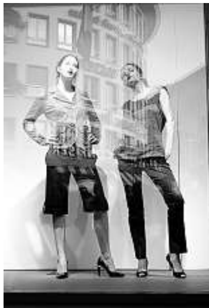
Ausgestellt: Zwei Miss-Südostschweiz-Kandidatinnen posieren hinter Glas.

Der grösste Auftritt der Kandidatinnen folgt im August: Dann wird die schönste Frau der Südostschweiz in Chur gekürt. (so)